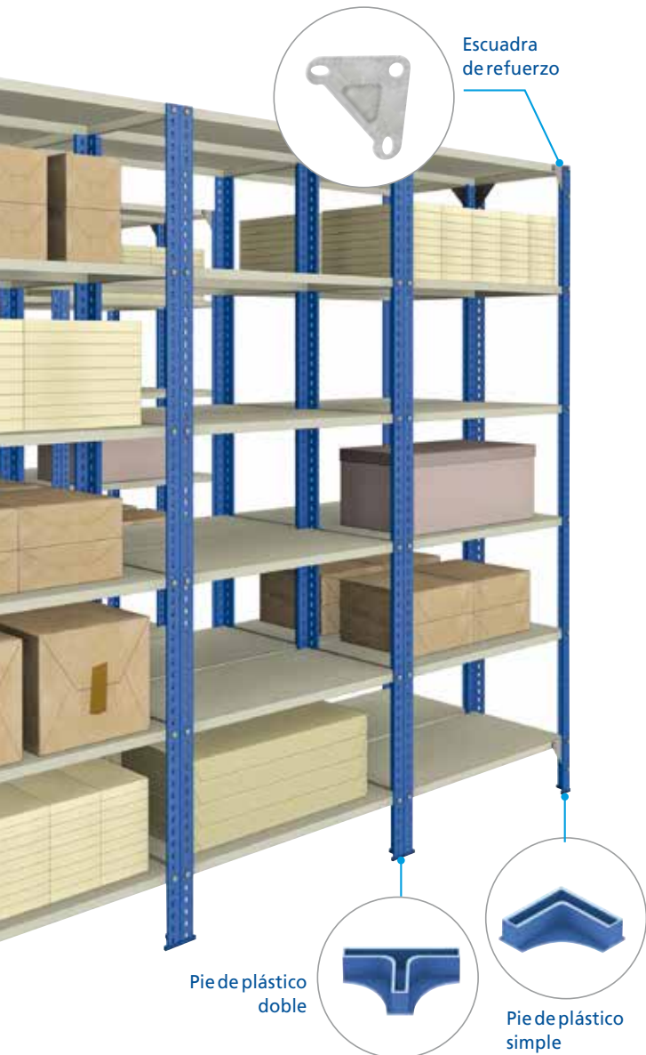
Pie de plástico doble